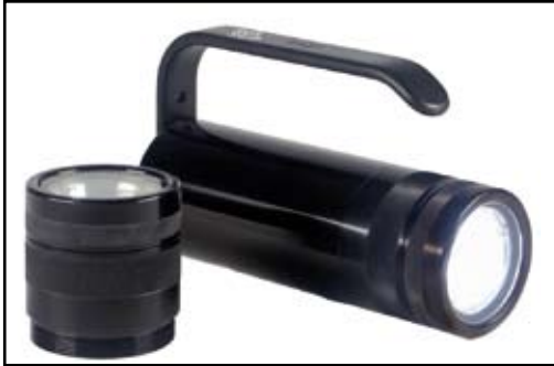
REVO mit Wechselkopf