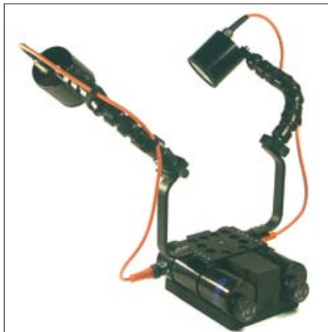
Bild links + unten: Light Station LiMn mit Ausbaustufe (Option); erweiterte Grundplatte, 2 Griffe mit Flexarmen und Auftriebskörper. Hervorragend geeignet für kleine UW-Videogehäuse ohne eigenes Griffsystem.

Da gerade kleine Videogehäuse über deutlichen Abtrieb verfügen, kann hier der Gesamtabtrieb durch den Auftriebskörper bis 20m Tauchtiefe ausgeglichen werden.