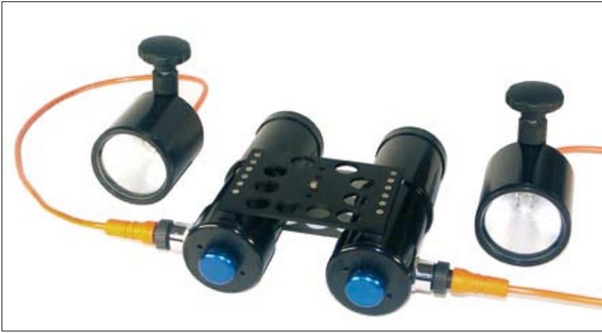
Bild oben: Grundausstattung: für UW-Videogehäuse die über ein eigenes Griff- und Flügelsystem verfügen.