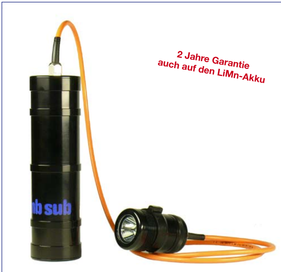
Tanksystem LED - CAVE in Grundausstattung. LED-Kopf mit wendbarem Schaltring (Transportsicherung)